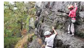
Jeudi 15 septembre, domaine de Clécy.