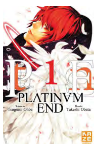
Couverture de tome 1 de Platinum End

Tsugumi Oba et Takeshi Obata ont sorti leur nouveau manga, Platinum End . L'album raconte l'histoire de Mirai Kakehashi, un étudiant vivant chez son oncle et sa tante suite à la mort de ses parents. Maltraité par les derniers membres de sa famille, il décide de se suicider. Il est sauvé par Nasse, un ange, qui lui offre des pouvoirs. Mirai reçoit des ailes, la flèche d'amour et la flèche de mort et apprend qu'il est un des candidats choisis pour être le prochain dieu. Mais il comprend que les autres compétiteurs sont prêts à tout pour gagner, même à tuer. Ce thriller qui joue avec la frontière entre le bien et le mal n'a pas fini de nous surprendre.