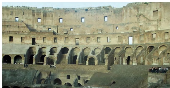
Le Colisée, un après-midi d'octobre.

Après un très long voyage en bus de plus de 1500 kilomètres, nous sommes arrivés à Rome. Nous avons pu visiter le premier forum romain, marcher sur la via Appia, voir l'immensité du Colisée ou encore découvrir des basiliques importantes. Nous avons vu le pape François de très près. Après