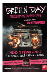
Revolution Radio est le dernier album de Green Day

Revolution Radio est le douzième et très engagé album de Green Day attendu depuis quatre ans. Sorti le 7 octobre 2016, il a reçu la note critique de 72/100 sur Metacritic.com. Succès total aux USA pour cet album plein d'énergie qui est monté sur la première marche du podium des US charts, dix jours, seulement, après sa sortie. L'album s'inscrit dans le genre musical Pop Punk, Rock, et Rock alternatif et parle de sujets d'actualité comme les émeutes raciales aux USA, la montée de Donald Trump ou bien encore des tueries de masse dans les écoles et lieux publics: les titres «Bang Bang» et «Troubled Times» prennent tout leur sens.