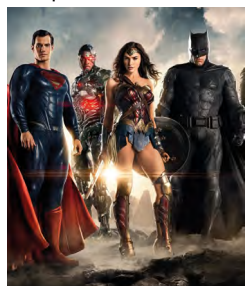
La première image de «Dawn of the Justice League»

Après plusieurs années d'attente, le film du groupe de Superman va bientôt sortir dans nos salles. Le but étant d'agrandir l'univers cinématographique de DC comics et de concurrencer Marvel. Armé d'un budget de 250 millions de dollars et s'annonçant plus sombre: Justice League arrive enfin. Suite à la défaite au box-office de Suicide Squad , DC remonte la barre en concurrençant Avengers . Certains des héros furent réunis auparavant dans Batman VS Superman . DC s'agrandira l'année prochaine avec notamment les films Wonder-woman , The Batman et bien sûr Justice league .