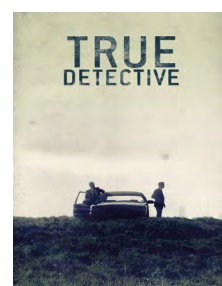
Le DVD de la série

True detective est une série policière fascinante, produite et diffusée par la chaîne américaine HBO, celle de Game of Thrones . L'histoire est celle de deux détectives qui mènent une enquête captivante sur un meurtre dans la Louisiane des années quatre-vingt-dix. L'ambiance y est souvent étrange et le bayou toujours en arrière plan sur les huit heures de la saison. Cette série est un véritable chef-d'œuvre. Les images sont magnifiques, la mise en scène digne du cinéma et Matthew McConaughey comme Woody Harrelson sont remarquables. Cette série vous tiendra en haleine jusqu'au bout. La 3 e saison est prévue pour 2018. A voir le plus vite possible!