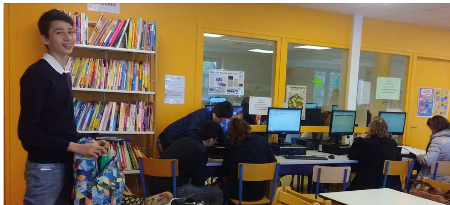
Un élève heureux au CDI