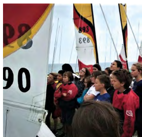
Les élèves de 6 e au char à voile remercient la base nautique EOLIA de fournir le matériel. Bon vent à nos jeunes collégiens!

Enfin...La plage! Les élèves de 6 e ne sont pas en vacances mais en Sport. Depuis deux ans que cette sortie existe, les participants sont enthousiastes: les élèves apprécient la découverte du char à voile et du catamaran et aussi celle du littoral. Bien évidemment, l'emploi du temps doit être légèrement changé. Mais c'est aussi pour les jeunes élèves l'occasion d'apprendre à être moins dissipés en suivant les règles de sécurité données par les moniteurs. Les enseignants d'EPS