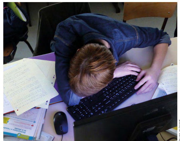
Epuisé, il s'endort sur le clavier