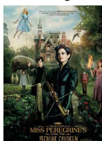
L'affiche du film

Après la mort de son grand père, Jacob un jeune garçon découvre l'existence d'un monde mystérieux où le temps semble s'être arrêté. Il va rencontrer Miss Pérégrine une femme énigmatique qui veille sur des enfants très particuliers. Il va se lier d'amitié avec eux mais surtout avec Emma, une «particulière» qui a le pouvoir de contrôler l'air et le vent. Quelques acteurs ayant participé à ce film: Éva Green (Miss Pérégrine); Ella Purnell (Emma); Asa Butterfield (Jacob). Comme à son habitude, Tim Burton crée un monde onirique et très étrange qui nous donne l'impression d'être avec les personnages dans le film.