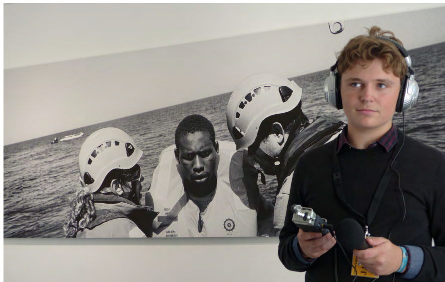
La prise de son à l'exposition du Radar sur les migrants.