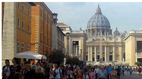
Direction : Place Saint Pierre