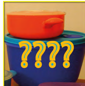
Pourquoi pas les tupperwares ?