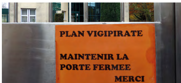
Un message en direction de tous ceux et celles qui fréquentent l'établissement de la maternelle au lycée.

Après les nombreux attentats que la France a connus au cours de ces deux dernières années, le gouvernement a décidé de renforcer le plan Vigipirate. Ce dispositif s'applique aux lieux publics tels que les écoles mais aussi aux rassemblements comme des manifestations ou des concerts. En voyant, le jour de la rentrée, des gendarmes armés devant les entrées principales du lycée et du collège Jeanne d'Arc, certains élèves ont été étonnés alors que d'autres ne s'en sont pas préoccupés. Nous avons demandé l'avis d'élèves de 4 e , 3 e et 2 nd e. Certains ont trouvé cela rassurant. D'autres ont eu l'impression d'être emprisonnés. Mais, pour la plupart, il était sécurisant d'être encadrés. Malgré cela, quelques élèves préfèrent rire du sujet plutôt que de voir la gravité de la situation. Cependant, certains s'interrogent : si des terroristes arrivaient, deux policiers suffiraient-ils à les arrêter ? Depuis, les semaines ont passé, un