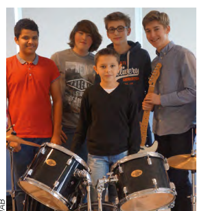
Un groupe prometteur